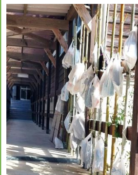
竹で作った下足袋釣り

今回初めて銭太鼓に参加させていただきました。恥ずかしながら久重に子供の頃から住んでいたにも関わらず今まで銭太鼓の事を知らず...子供と一緒に参加させて頂き、想像以上に難しかったです。だけど、地域の先輩方から教えて頂き皆さんと練習をして舞台が無事に終わった時は楽しかった〜って気持ちでした。まだまだ未熟ですがこれからも次の世代へ伝承できるように子供達と頑張って練習していきたいと思っています。