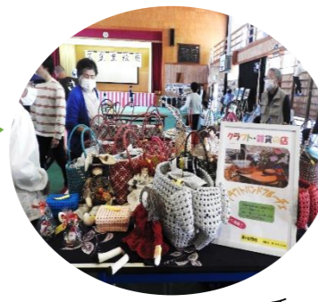
クラフトバンドフルーチェ

私が今回1番嬉しかったことは、学生や子どもたちが集まって作業を手伝ってくれたこと。餅を袋に入れるのにどうやったら効率がええろう、など話し合いをしながら自分たちで考えて作業してくれていました。みんな初めてのことだったろうに、一生懸命手伝ってくれてありがとう。